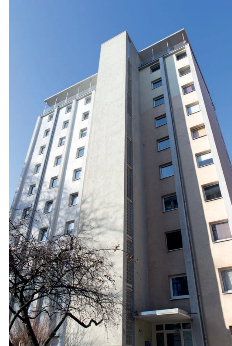
Mittendrin im urbanen Leben: Hermann-Heimerich-Haus in N6.

Deine Bewerbung auf einen Wohnplatz in einem der Häuser des Studierendenwerks war nicht erfolgreich? Dann schau doch mal unter www.gib-bildung-ein-zuhause.de . Dort findest du neben einer Online-Privatzimmerbörse auch Informationen zu unserem Projekt „Wohnen für Hilfe“.