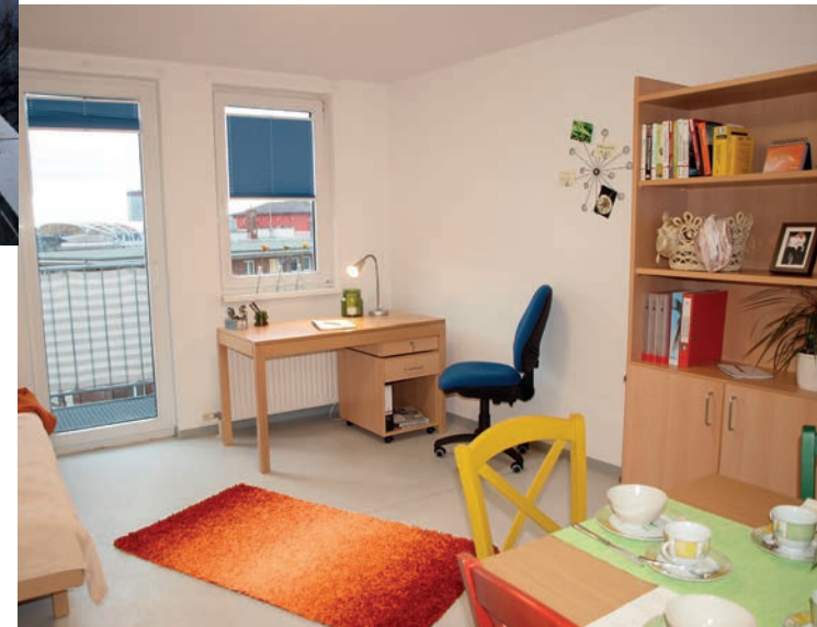
„Home Sweet Home“ in der Wohnanlage am Parking.

Ob Apartment oder Zimmer in einer Flurgemeinschaft, ob im traditionellen Arbeiterviertel oder im noblen Stadtteil – für jeden Bedarf, für jeden Geschmack hat das Studierendenwerk das passende Angebot. Für Neu-Mannheimer bietet sich das Leben in der Gemeinschaft an – in der Küche sind schnell erste Kontakte geknüpft und Verabredungen getroffen.