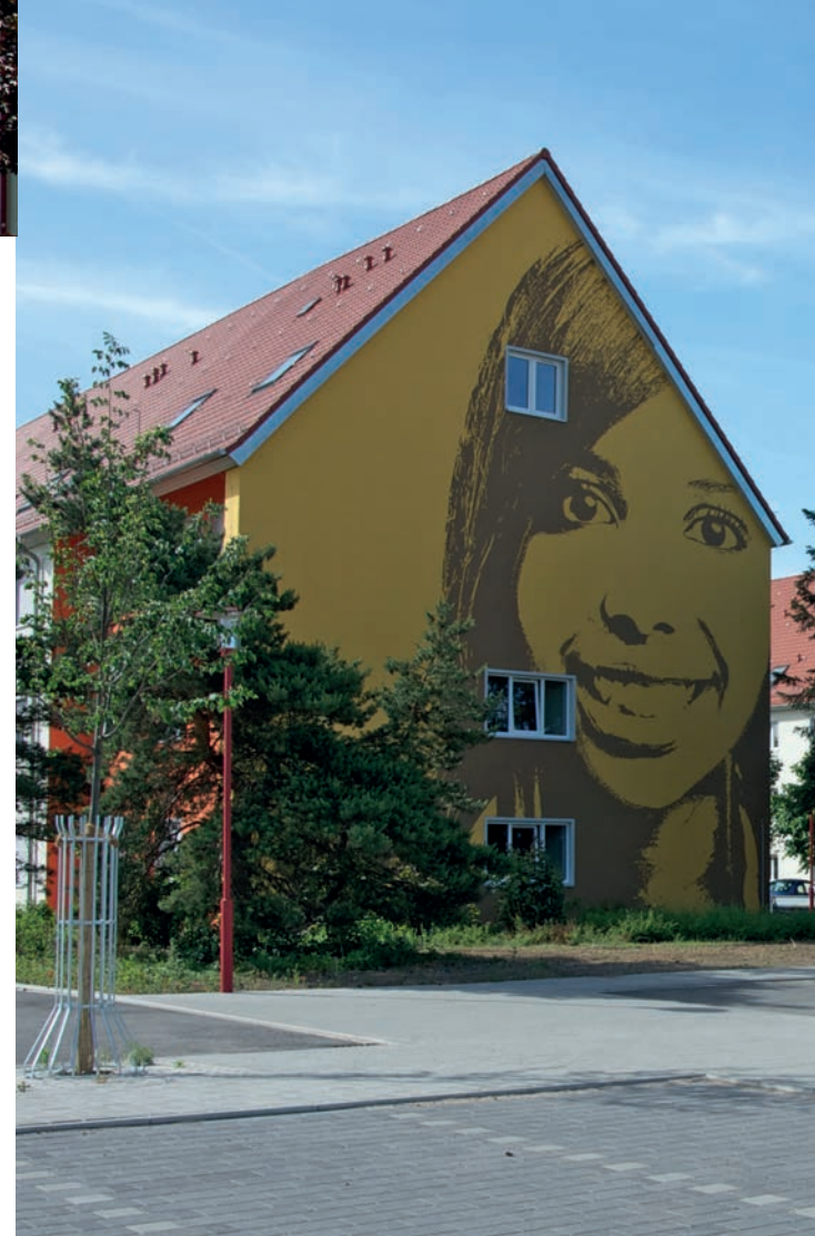
Stud.-Siedlung Ludwig-Frank mit über 700 Wohneinheiten.

Damit sich die studentischen Mieterinnen und Mieter voll und ganz auf ihr Studium konzentrieren können, ist auch der Service durch die freundliche Hausbetreuung inklusive. Sie hilft beim Einzug, repariert tropfende Wasserhähne und sorgt dafür, dass es sommers wie winters rund ums Haus ordentlich aussieht und die Zugangswege sicher zu begehen sind.