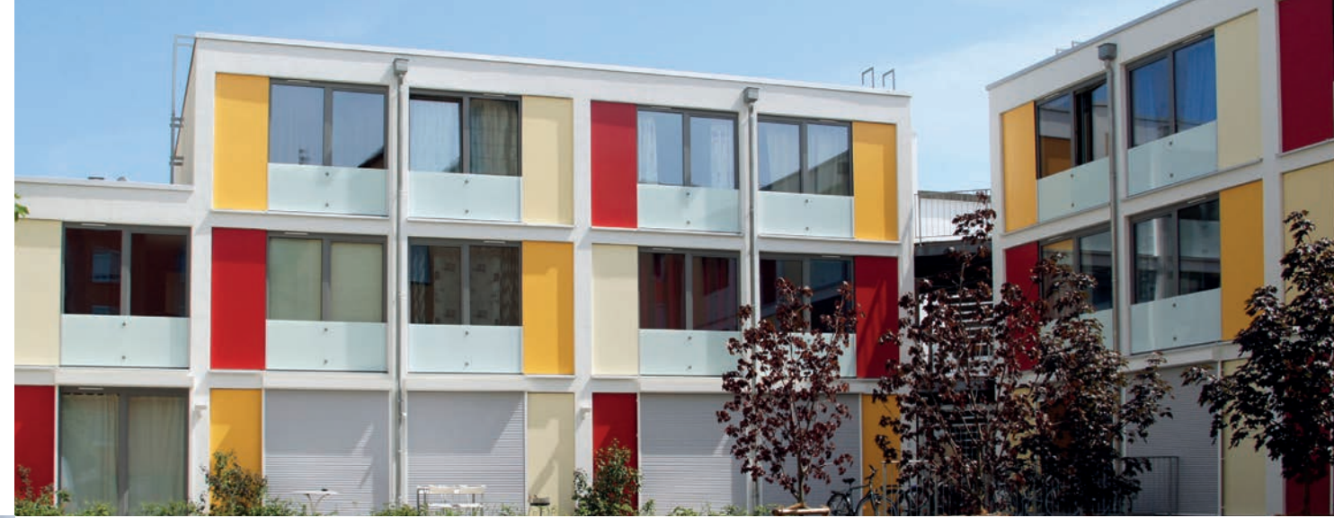
Stylisch und komfortabel: Die Apartments in der Wohnanlage B 7.

Aktuell sind rund 3.000 Wohnplätze in 16 Anlagen mit unterschiedlichem Charakter im Angebot. Die Bandbreite reicht dabei vom Energiesparhaus „Eastsite“ über die zum studentischen Mikrokosmos umgebaute Kasernenanlage in der Neckarstadt bis zum Rooftop Apartment in der Augartenstraße oder einer komplett renovierten Wohnanlage im trendigen Hafenviertel.