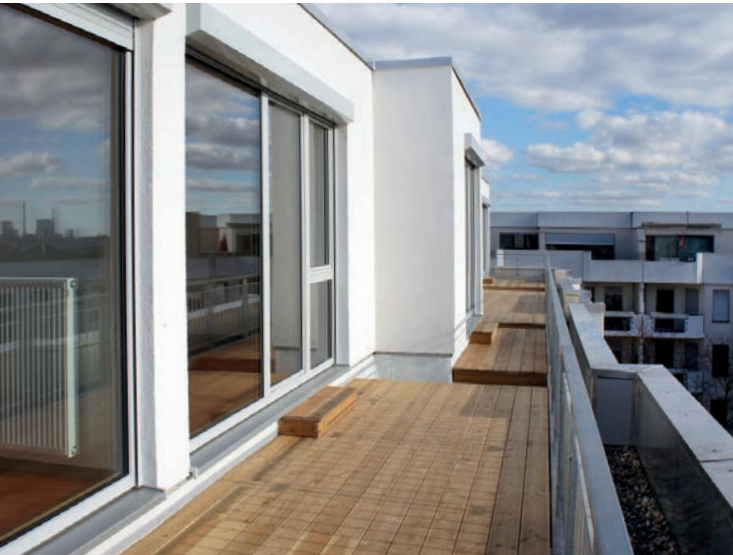
Rooftop-Apartments: Weiter Blick über den Dächern Mannheims.

Das Lernklima bleibt dabei nicht auf der Strecke – konzentriertes Arbeiten im ruhigen Einzelzimmer ist überall möglich. Und auch für Studierende mit Kind oder Studierende mit Handicap kann das Studierendenwerk geeigneten Wohnraum zur Verfügung stellen.